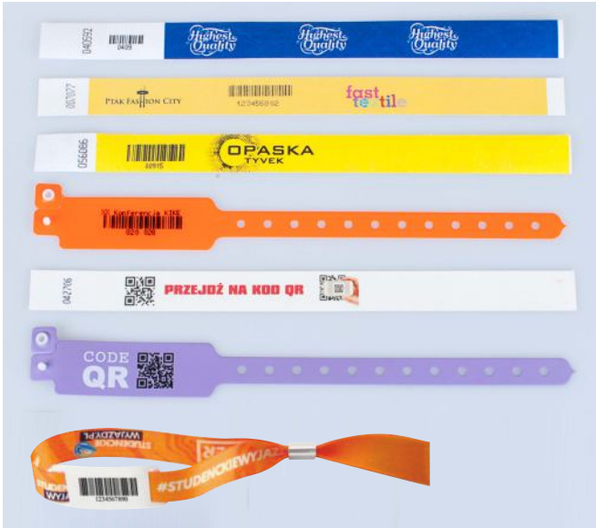
Aufdrucke von Codes 128, 2/5, 2D, QR auf Tyvek-, Vinyl- und Festivalarmbändern