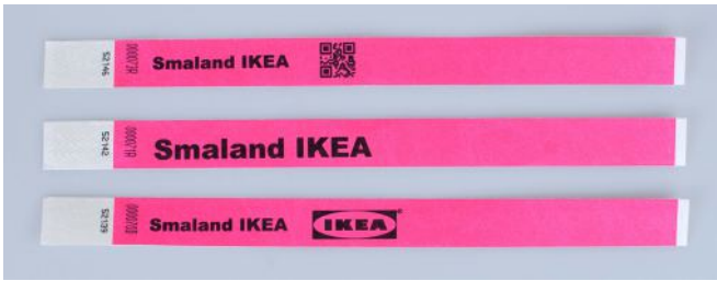
Aufdruck der zusätzlichen Nummerierung auf Tyvek – Armbändern