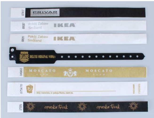
Die Standardfarben von den Logo-Aufdrucken sind: schwarz, weiß, gold, und silber. Auf den Kundenwunsch führen wir auch die Aufdrucken laut der Pantone-Farben aus.